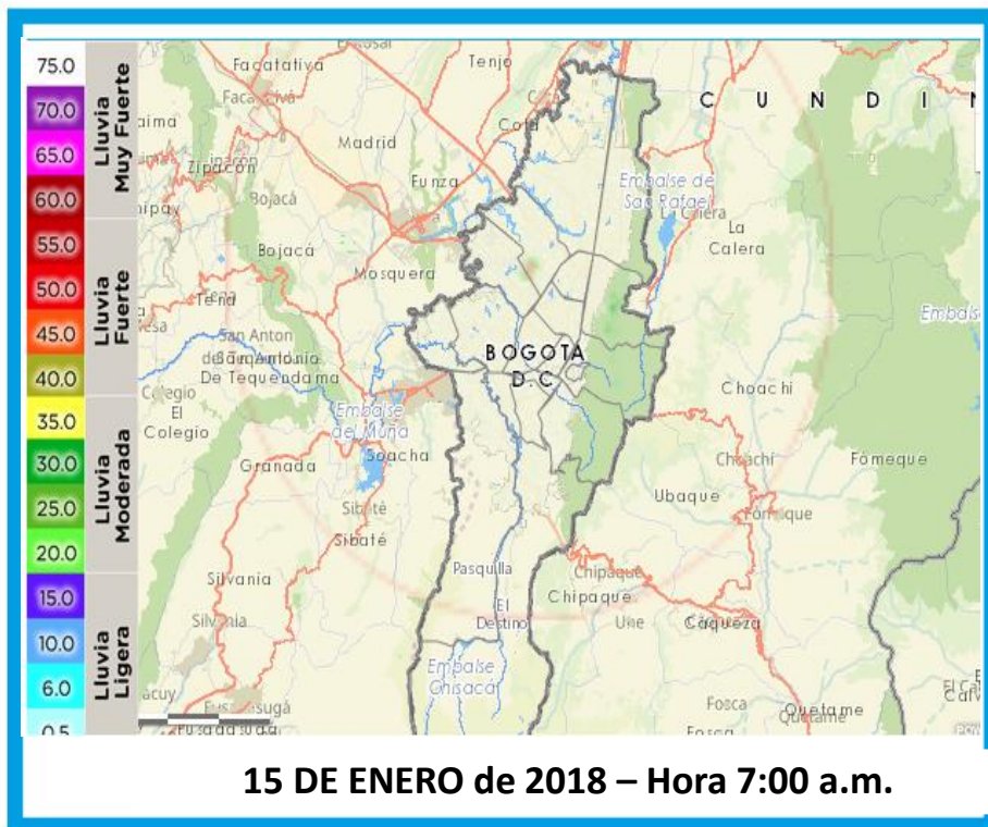
IMAGEN DEL RADAR Reflectividad

La temperatura mínima, de acuerdo con el la estación del aeropuerto El Dorado fue de 6.0 °C.